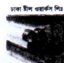
ঢাকা ট্রাক ওয়ার্কস পিঃ এম এন রত্ন, ও বার সান্ডা