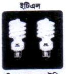
ইটিএল পিএফএল, এলইডি ও টিউব লাইট