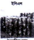
ইসিএল বেদান্তিক ভাষা