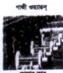
গামী ওয়ার্কস ভাষার ভাষা (এনইসি, এসি, এইচ ডিবিসি)