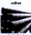
এনটিএল এপিআই, জিআই একসে পাইপ