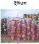
ইসিএল বৈদ্যুতিক তার