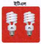
ইটিএল সিএফএল, এলইডি ও টিউব লাইট