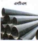
এনটিএল এপিআই, জিআই এনএস পাইপ