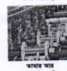
পালী ভরাদস কামার তার (এসইসি, এসি, এইচ ডিবিসি)