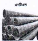
এনটিএল এনআই, ফিলাই এসএল পাইপ