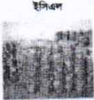
ইসিএল বৈদ্যুতিক তার