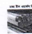
ঢাকা স্টিল রবার্টস লিঃ এস এস রড ও বার সাহাযী

স্মারক নং-৩৬.৯৩.০০০০.০১৬.০২.০০৩.১৮. ২৫৫৪