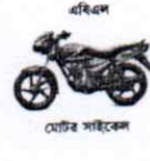
এবিএল মোটর সাইকেল