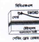
পিবিএকএল সোর্ড স্ট্রিংলেস ফাল্গোনে ২০০৮ পেজিং ব্রেক রেজর