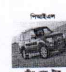
পিআইএল জীপ, বাস, ট্রাক