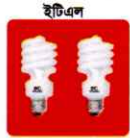
ইটিএল সিএফ-এল, এলইডি ও টিউব লাইট