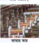
গাজী ওয়ারস ভামার তার (এসইসি, এসি, এইচ ভিভিসি)