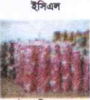
ইসিএল বৈদ্যুতিক তার