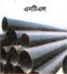
এনটিএল এপিআই, জিআই এমএস পাইপ