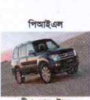
পিআইএল জীপ, বাস, ট্রাক