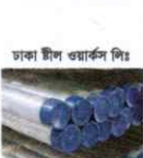
ঢাকা স্টীল ওয়ারস পাইপ এম এল রড ও বার সামগ্রী