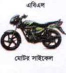
এবিএল মোটর সাইকেল