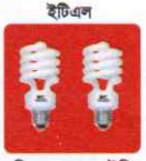
ইটিএল সিএফএল, এলইডি ও টিউব লাইট